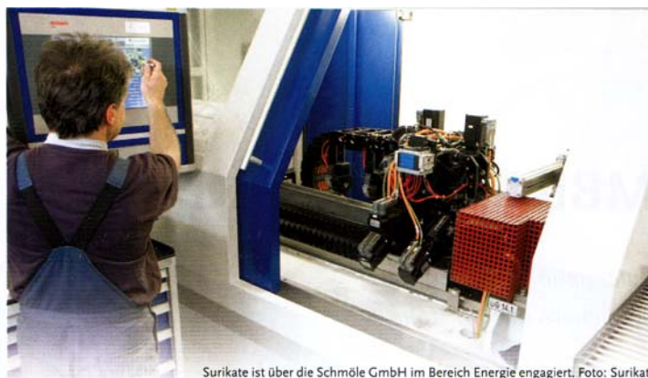
Surikate ist über die Schmöle GmbH im Bereich Energie engagiert.